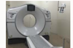
GE Revolution GSI

最新の画像再構成方式で従来よりもX線量を抑えた検査が行えます。 必要に応じ、3D画像の作成などにも対応しています。 注意事項: ペースメーカー、ICDをご使用の方はお申出ください。